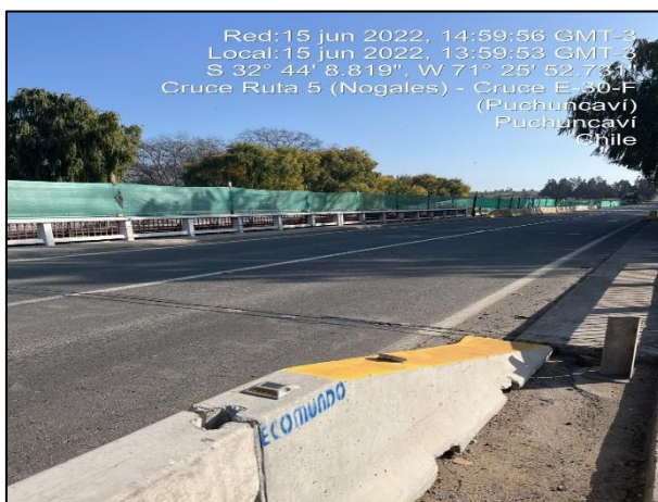
Figura 10: Recambio de malla raschel como medida de mitigación en margen izquierdo, entorno al sector de obras del Puente Puchuncaví