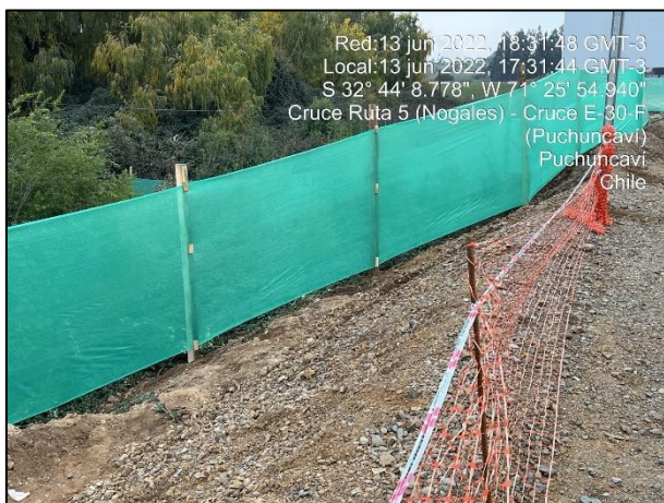
Figura 05: Se continua con la postura de malla raschel como medida de mitigación en el entorno al sector de obras del Puente Puchuncavi