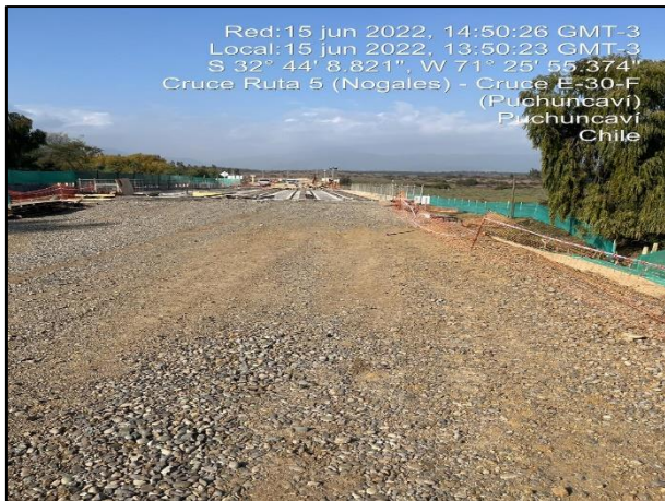
Figura 14: Vista desde estribo de salida al entorno de sector de obras del Puente Puchuncavi margen izquierdo