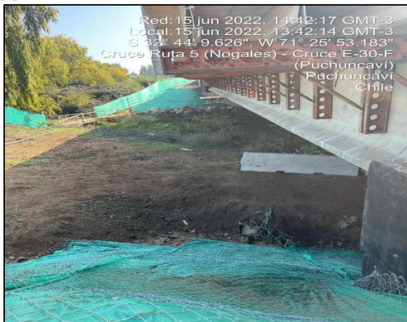
Figura 18: Vista al margen izquierdo del entorno a Puente Puchuncaví observándose las diferentes medidas de mitigación implementadas