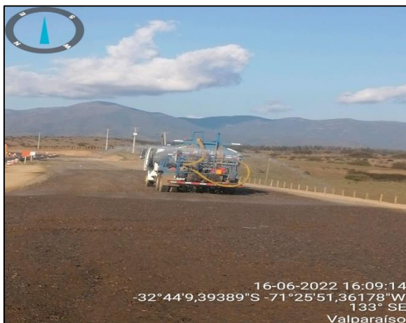
Figura 20: Humectación mediante camión aljibe cercano a al sector de obras del Puente Puchuncaví