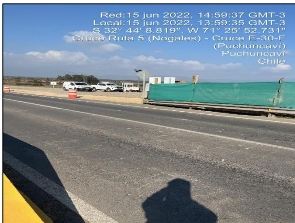
Figura 11: Recambio de malla raschel como medida de mitigación en margen izquierdo, entorno al sector de obras del Puente Puchuncaví