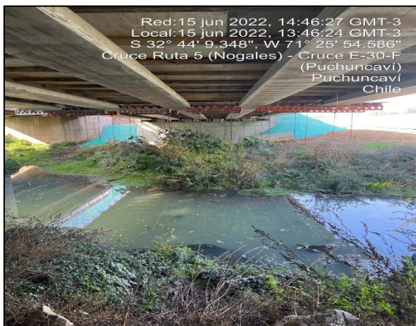
Figura 16: Vista bajo Puente Puchuncaví observándose las diferentes medidas de mitigación implementadas