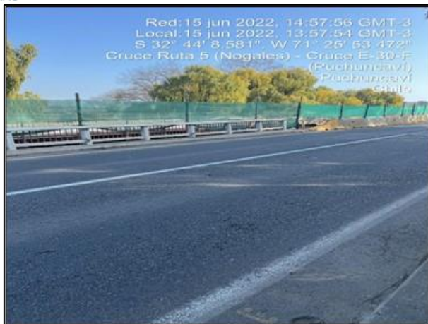
Figura 9: Recambio de malla raschel como medida de mitigación en margen izquierdo, entorno al sector de obras del Puente Puchuncaví