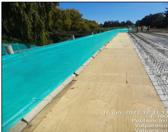
Figura 21: Se continua con la postura de malla raschel como medida de mitigación en el entorno al sector de obras del Puente Puchuncaví