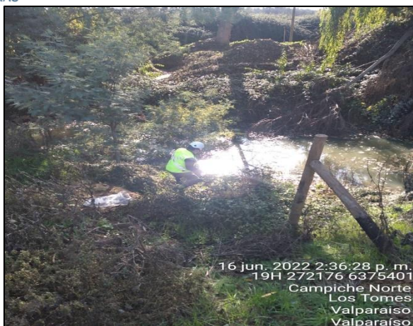
Figura 27: Toma de muestras de agua en Puente Puchuncaví en margen derecho