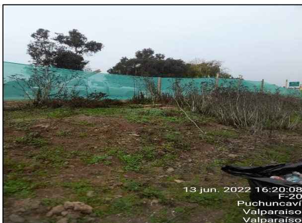
Figura 02: Limpieza en el entorno al sector de obras Puente Puchuncavi margen derecho dm 25360 aprox.