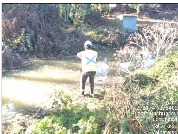
Figura 28: Toma de muestras de agua en Puente Puchuncaví en margen derecho