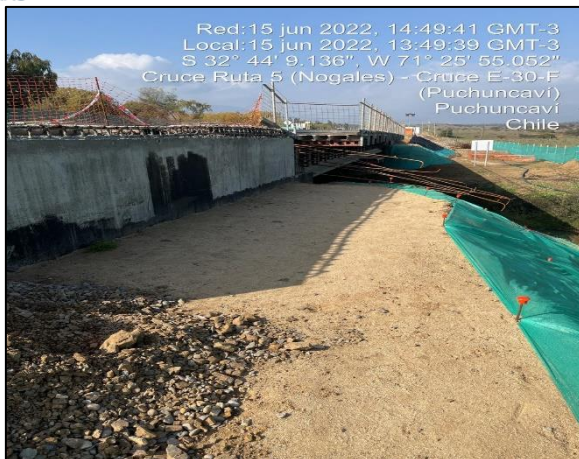
Figura 15: Vista al entorno de sector de obras del Puente Puchuncaví margen izquierdo