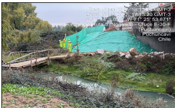
Figura 01: Recubrimiento de talud en el entorno al sector de obras al Puente Puchuncaví margen izquierdo dm 25.360 aprox.

Seguimiento fotográfico de la implementación de diferentes medidas de mitigación entorno al sector de obras del Puente Puchuncavi.