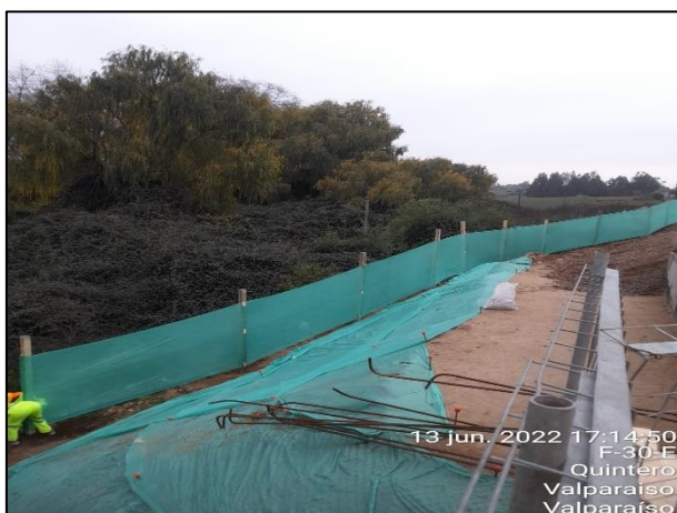
Figura 04: Se continua con la postura de malla raschel como medida de mitigación en el entorno al sector de obras del Puente Puchuncavi