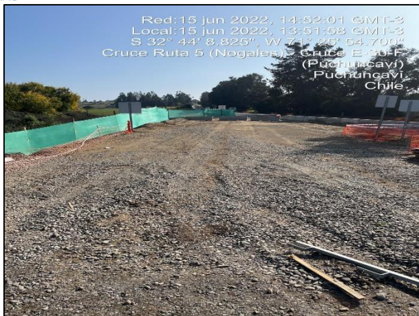
Figura 12: Vista desde el estribo de entrada al entorno de sector de obras del Puente Puchuncavi margen izquierdo