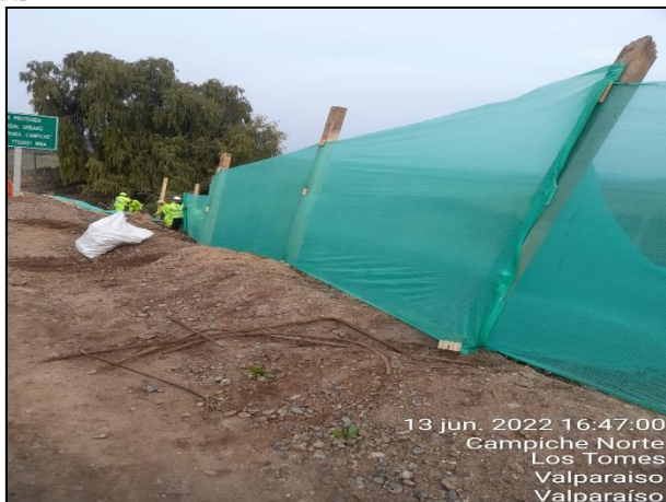
Figura 03: Se continua con la postura de malla raschel como medida de mitigación en el entorno al sector de obras del Puente Puchuncavi