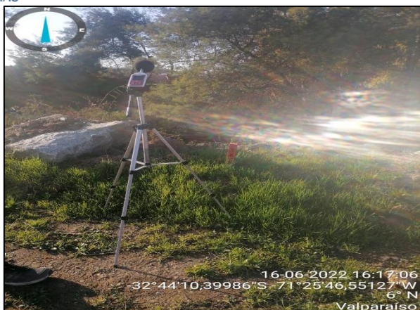
Figura 28: Monitoreo de Ruido en Puente Puchuncaví en margen derecho