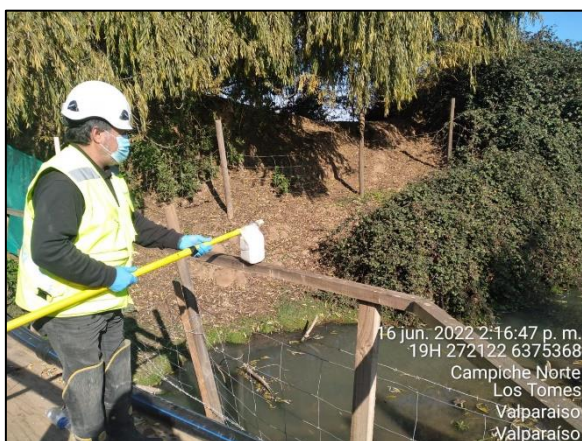
Figura 25: Toma de muestras de agua en Puente Puchuncaví en margen izquierdo