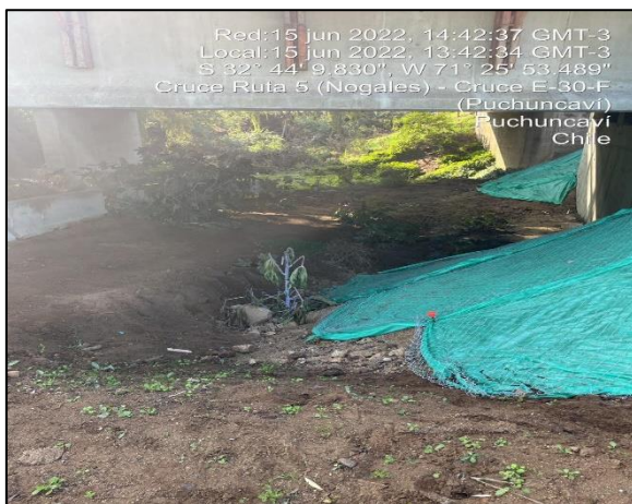
Figura 19: Vista bajo el Puente Puchuncaví observándose las diferentes medidas de mitigación implementadas