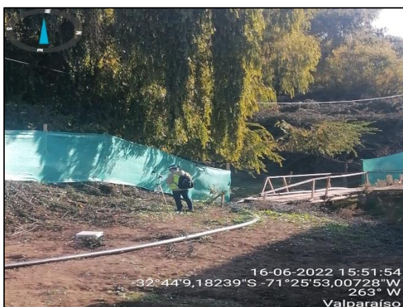
Figura 28: Monitoreo de Ruido en Puente Puchuncaví en margen izquierdo