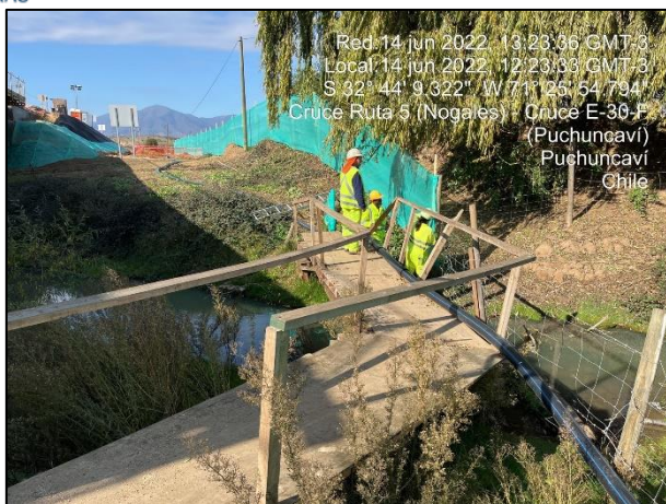
Figura 06: Se continua con la postura de malla raschel como medida de mitigación en el entorno al sector de obras del Puente Puchuncaví