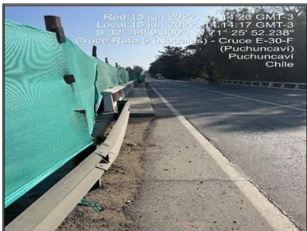
Figura 08: Recambio de malla raschel como medida de mitigación en margen izquierdo, entorno al sector de obras del Puente Puchuncaví