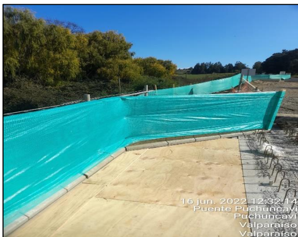
Figura 22: Se continua con la postura de malla raschel como medida de mitigación en el entorno al sector de obras del Puente Puchuncaví