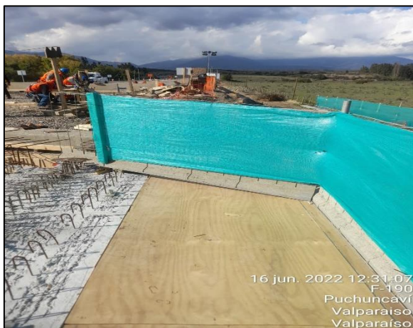
Figura 23: Se continua con la postura de malla raschel como medida de mitigación en el entorno al sector de obras del Puente Puchuncaví