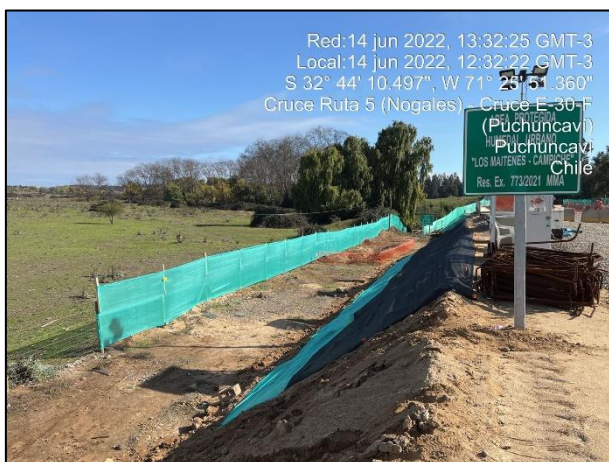
Figura 07: Se continua con la postura de malla raschel como medida de mitigación en el entorno al sector de obras del Puente Puchuncaví