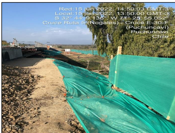
Figura 13: Vista desde estribo de salida hacia el entorno del sector de obras del Puente Puchuncavi