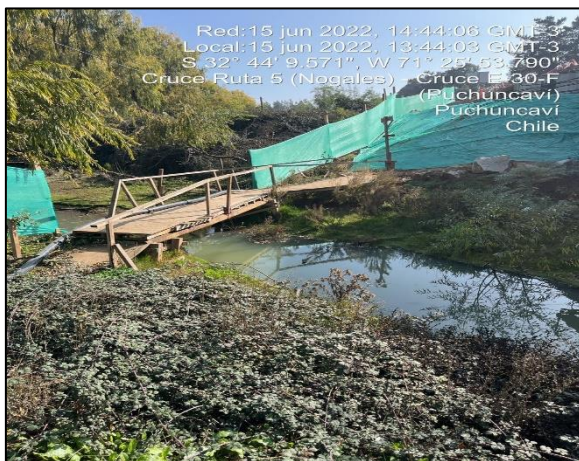
Figura 17: Vista al margen izquierdo del entorno a Puente Puchuncaví observándose las diferentes medidas de mitigación implementadas